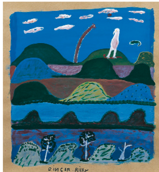
In een kleurrijke, naïef figuratieve stijl schildert Ginger Riley (ca. 1937 - 2002) het land van zijn voorvaders met daarin mythologische wezens als de regenboogslang en de witte zeearend. Ngak Ngak acting as Sentinel in Limmen Bight Country, 1993